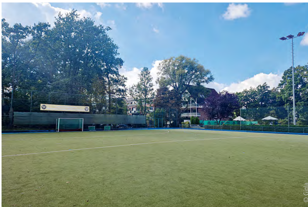
Abb. 2: Sportplatz in einem Wohngebiet. Die wohnortnahe Sportausübung wird seit der Änderung der Sportanlagenlärmschutzverordnung im Jahr 2017 durch höhere Immissionsrichtwerte und längere Nutzungszeiten erleichtert.

Straßenverkehrslärm wird beispielsweise durch die Absenkung der zulässigen Höchstgeschwindigkeit im Nachtzeitraum, durch die Verminderung des Lkw-Anteils oder durch lärmarme Straßenoberflächen reduziert. In den zurückliegenden Jahren ist das Bewusstsein für die verträgliche Gestaltung des Umgebungslärms gestiegen. Hierzu haben die strategischen Lärmkarten zur Umsetzung der europäischen Umgebungslärmrichtlinie (34. BImSchV) beigetragen. Die Lärmkartierungen werden der Bevölkerung zur Information online zur Verfügung gestellt.