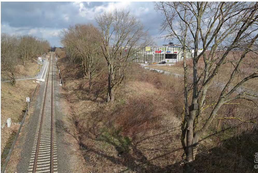
Abb. 1: In der Praxis werden Maßnahmen gegen unterschiedliche Lärmquellen häufig unzureichend abgestimmt: Der Schallschutzwall schirmt das Wohngebiet nur gegen den Schienenverkehrslärm ab. Der Straßenverkehrslärm wird nicht abgeschirmt und durch Schallreflexion am Wall sogar verstärkt.

Die Neufassung der DIN-Norm 18005 »Schallschutz im Städtebau« mit dem dazugehörigen Beiblatt 1 ist im Juli 2023 erschienen und löst die Norm aus dem Jahr 2002 sowie das Beiblatt 1 aus dem Jahr 1987 ab. Die Norm ist eine Grundlage zur Berücksichtigung des Schallschutzes bei der städtebaulichen Planung und für die Bemessung der Luftschalldämmung von Fassaden- und Dachflächen. Nach DIN 4109-2 werden die Beurteilungspegel für Straßenverkehr mithilfe der Nomogramme nach DIN 18005-1:2002-07, A.2, ermittelt. Diese wurden in der Neufassung auf den Stand »RLS-19« aktualisiert. Der folgende Beitrag fasst die wesentlichen Inhalte und Änderungen zusammen.