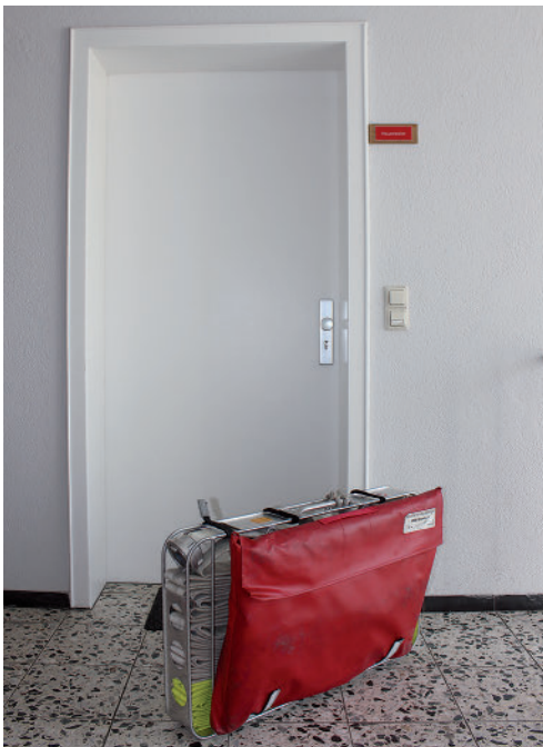
Bild 1.2 Beispiel für die schadenarme Einsatztaktik: Ein mobiler Rauchverschluss wird am Schlauchtragekorb mitgeführt und kann so vor dem Eindringen in die Wohnung zur Verhinderung einer unkontrollierten Rauchausbreitung in den Treppenraum schnell montiert werden.

Dem hohen Vertrauen der Bevölkerung in die Fähigkeiten der Feuerwehrangehörigen ist natürlich auch die hohe Erwartungshaltung des Hilfesuchenden bzw. Betroffenen geschuldet: Er erwartet – zu Recht! – eine schnelle, professionelle und erfolg-