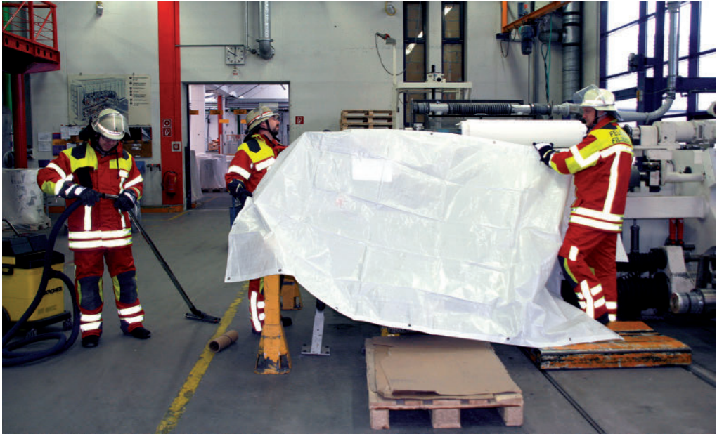
Bild 1.3 Zur Kundenorientierung gehört auch das Business-Continuity-Management. Die Feuerwehr könnte dabei z. B. noch während der Brandbekämpfung Maschinen vor Wasser schützen.